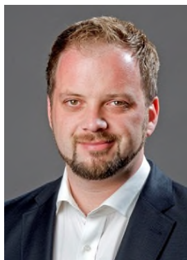
Oberbürgermeister Tobias Eschenbacher